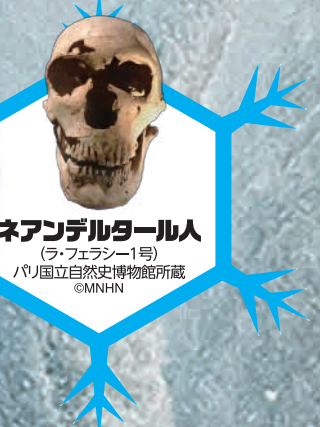
ネアンデルタール人 (ラ・フェラスー1号) パリ国立自然史博物館所蔵 ©MNHN