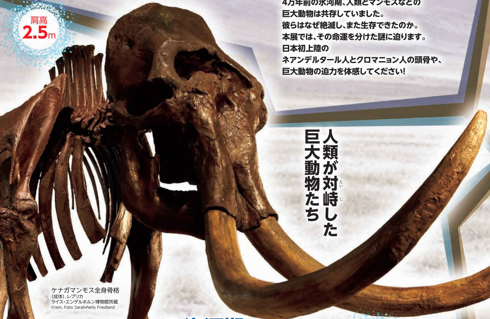
ケナガマンモス全身骨格 (成体)、レアリカ ライス・エンゲルホルン博物館所蔵 Crem

4万年前の氷河期、人類とマンモスなどの巨大動物は共存していました。彼らはなぜ絶滅し、また生存できたのか。本展では、その命運を分けた謎に迫ります。日本初上陸のネアンデルタール人とクロマニヨン人の頭骨や、巨大動物の迫力を体感してください！