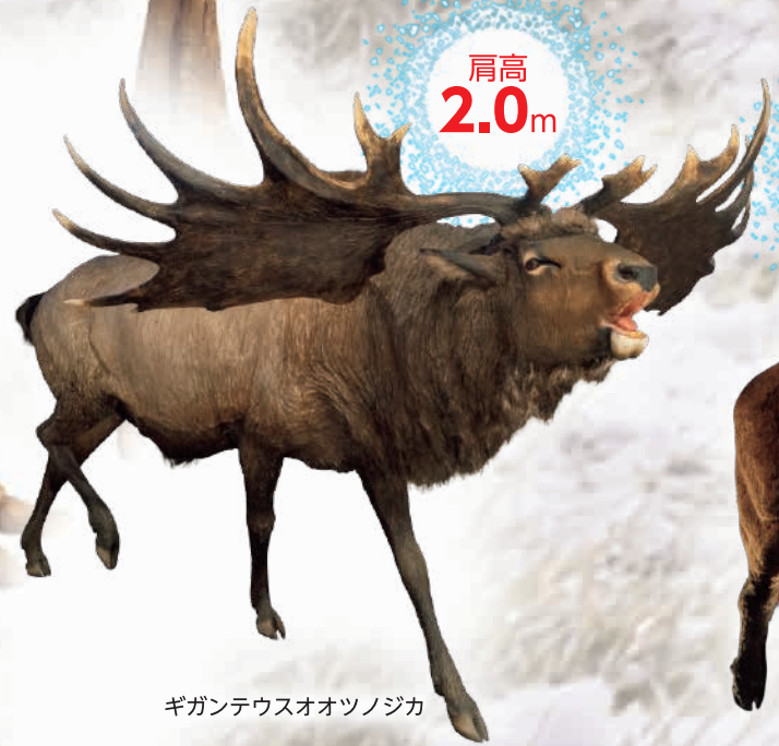
ギガンテウスオオツノジカ