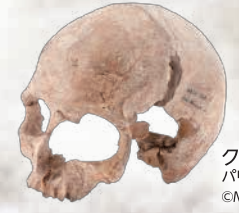
クロマニヨン2号 パリ国立自然史博物館所蔵