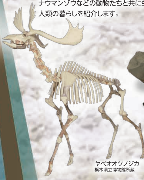
ヤベオオツノジカ 栃木県立博物館所蔵