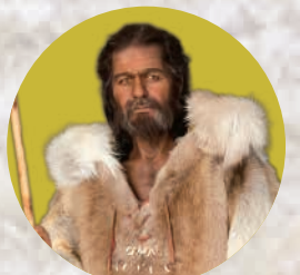
クロマニヨン人(1号) 復元模型 ©2025 Sculpture ELISABETH DAYNÈS France