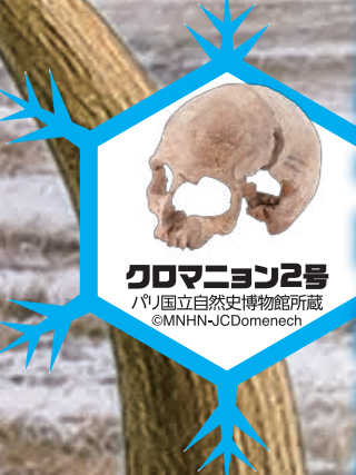
クロマニヨン2号 パリ国立自然史博物館所蔵