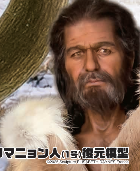
クロマニヨン人(1号)復元模型 ©2025 Sculpture ELISABETH DAYNÉS France