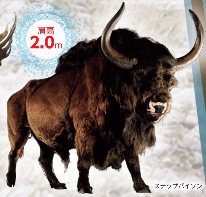
ステップバイソン