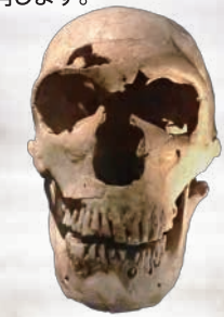
ネアンデルタール人 (ラ・フェラシー1号) パリ国立自然史博物館所蔵