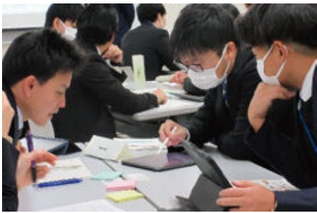
令和7年度の講座の様子