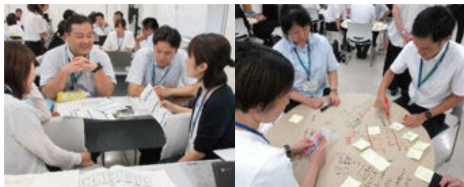
令和7年度の研修の様子

※ 外部講師による講義・演習のテーマや研修の内容は、ホームページを御覧ください。