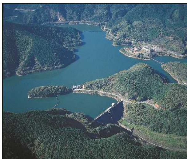
力丸ダム(八木山川 宮若市)