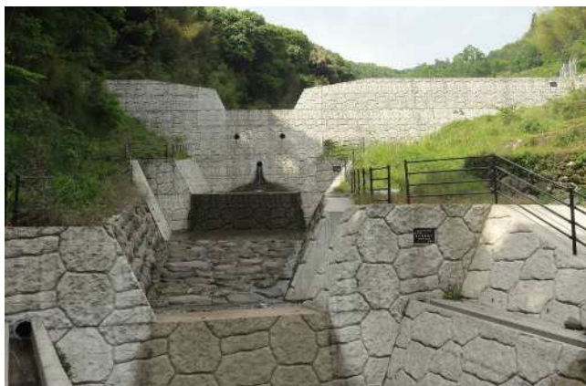
砂防堰堤(山中川 八女市黒木町)