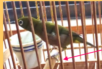
飼養登録を受けたメジロ