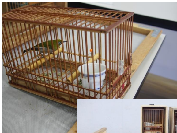
警察に押収されたメジロ