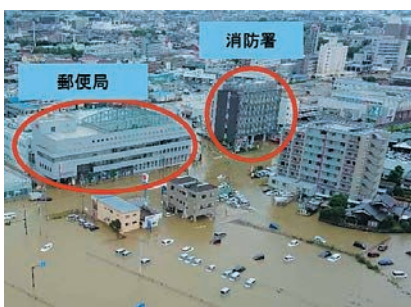
久留米市御井地区 (H30.7)