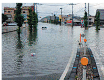
大牟田市三川地区 (R2.7)