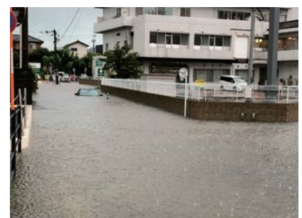
久留米市新合川地区 (R5.7)