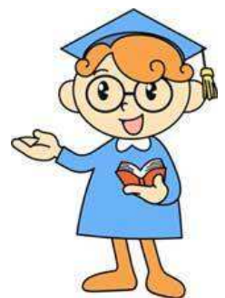
ヒューマン博士 (福岡県の人権啓発 キャラクター)