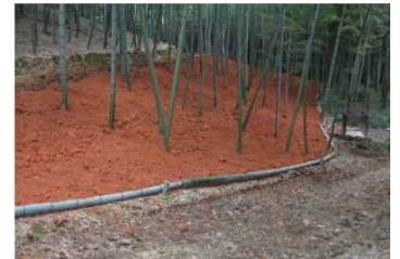
客土による竹林の改良