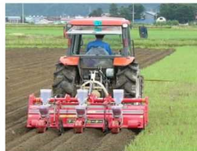
播種同時うね立て