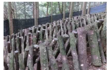
ほだ場の防獣設備