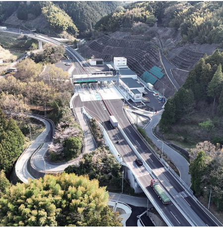
① 一般国道201号 八木山バイパス (篠栗町、飯塚市)