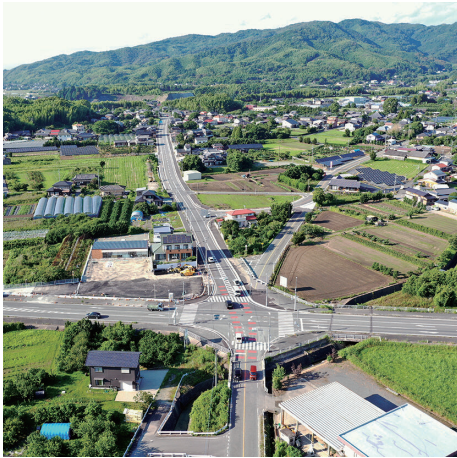
⑮ 一般県道 飯江長田線 (みやま市)