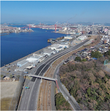
⑯ 北九州高速道路5号線 (北九州市)