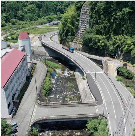
③ 一般国道442号 宮ノ尾橋 (八女市)