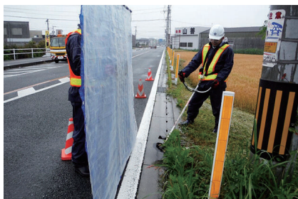
安全な通行を妨げている雑草の草刈