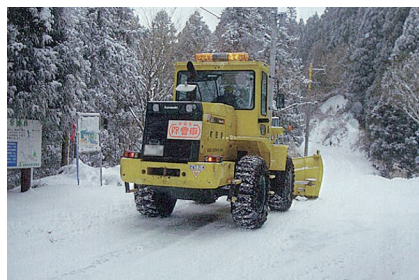
積雪時の雪氷対策