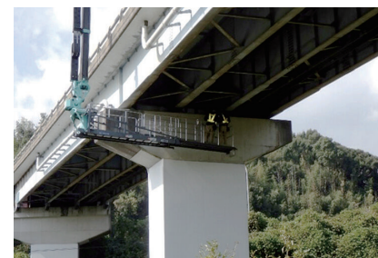
橋梁定期点検の状況