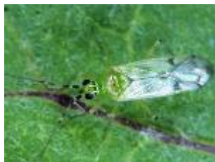
タバコカスミカメ成虫

このため、これらの害虫が発生した場合には、タバコカスミカメに対して影響の少ない選択的殺虫剤で防除する。なお、選択的殺虫剤に関する情報については、常に最新の情報を普及指導センターやJA等、指導機関から入手しておく。