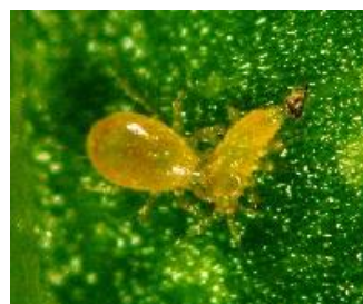
アザミウマ幼虫(右)を捕食する スワルスキーカブリダニ(左)