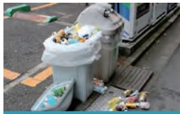
あふれかえったごみ箱