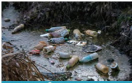
ポイ捨てされたごみ