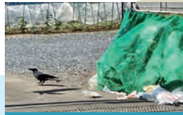
動物に荒らされたごみ

海に流れ出たプラスチックごみが地球環境や私たちの生活に与える影響は、海洋プラスチック問題として世界的な課題になっています。