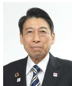
令和6年12月 福岡県知事 服部 誠太郎

この冊子は、令和5年度の福岡県の決算の概要を紹介するものです。県民の皆さまが将来の福岡県を考えていく一助としてご活用いただければ幸いです。