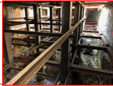
地中での作業状況