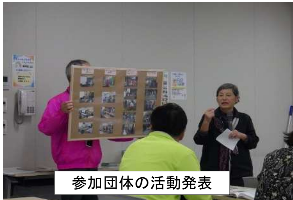
参加団体の活動発表