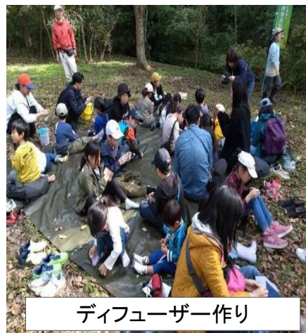
ディフューザー作り