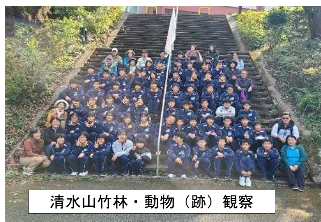
清水山竹林・動物（跡）観察