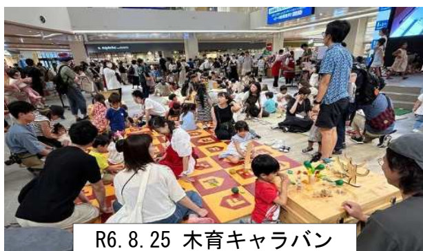
R6. 8. 25 木育キャラバン