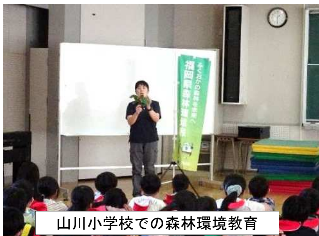
山川小学校での森林環境教育