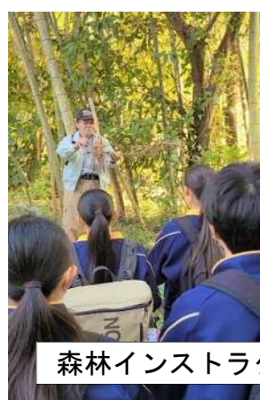
森林インストラクターによる説明