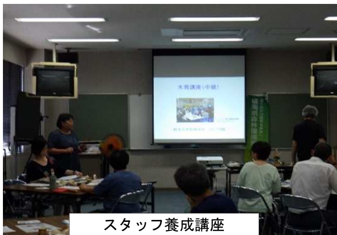
スタッフ養成講座