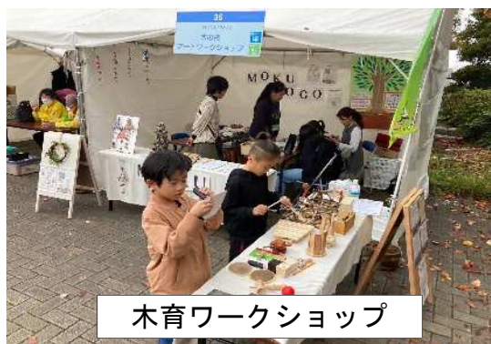
木育ワークショップ