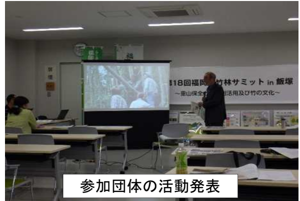
参加団体の活動発表