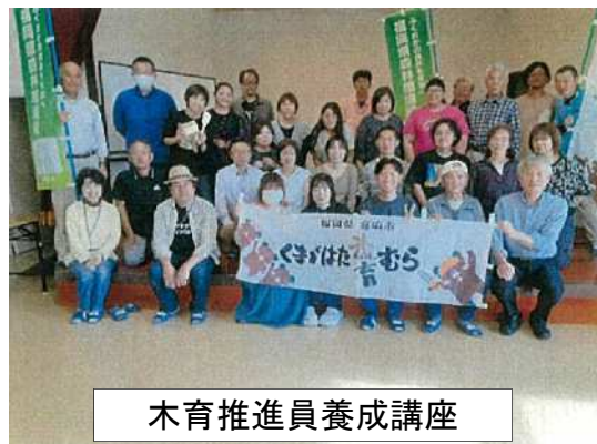
木育推進員養成講座