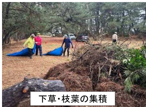
下草・枝葉の集積