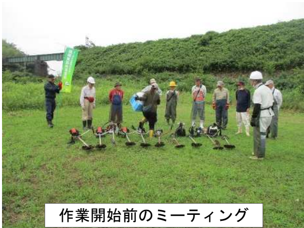
作業開始前のミーティング