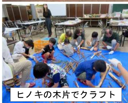
ヒノキの木片でクラフト