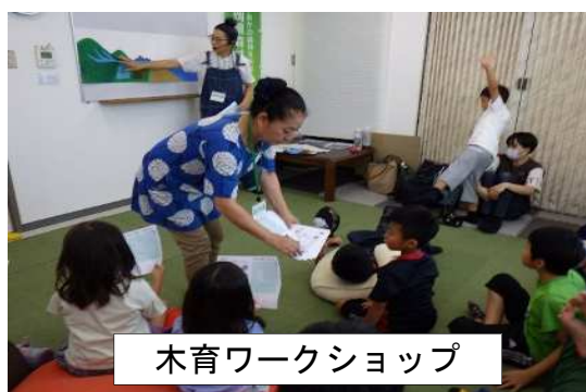
木育ワークショップ