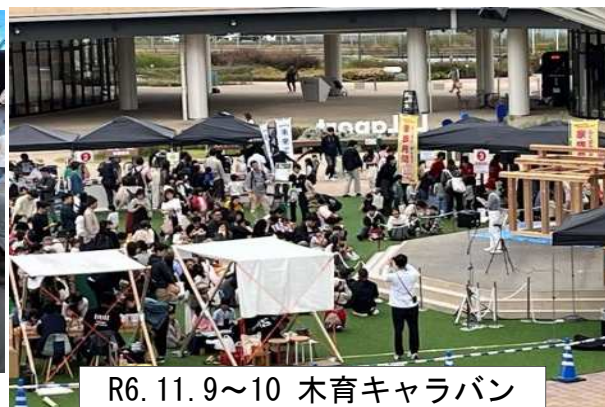
R6. 11. 9～10 木育キャラバン