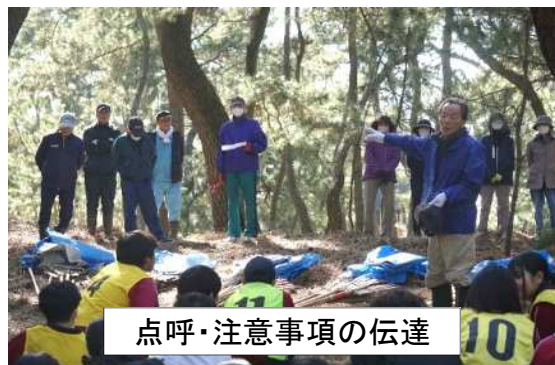
点呼・注意事項の伝達