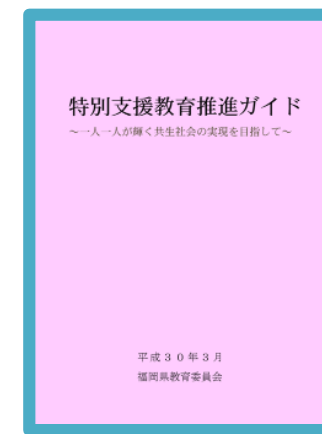
特別支援教育推進ガイド