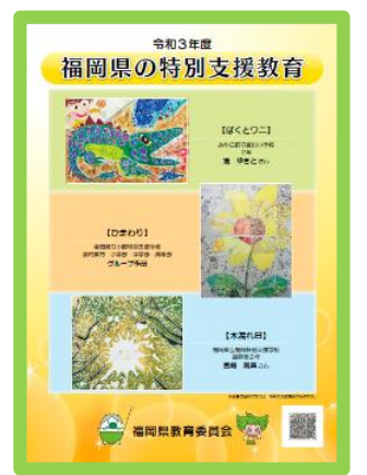
福岡県の特別支援教育