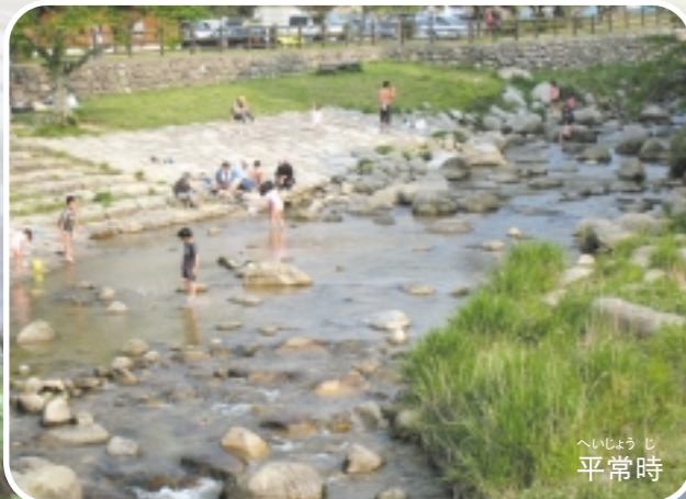
へいじよう じ 平常時