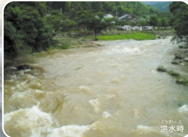
こうすい じ 洪水時