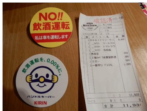
ハンドルキーパーバッジと 確認済みの伝票