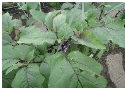
天敵の定着は、葉の穴の発生で確認