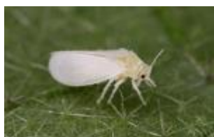
タバコナジラミ成虫

成幼虫ともに植物の汁液を吸汁し、排泄物(甘露)によって葉や果実にすす症状を発生させる。