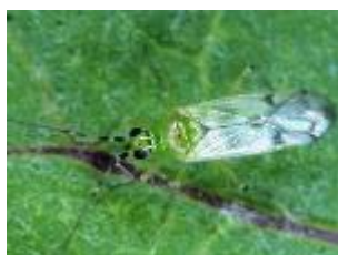
タバコカスミカメ成虫

このため、これらの害虫が発生した場合には、タバコカスミカメに対して影響の少ない選択的殺虫剤で防除する。なお、選択的殺虫剤に関する情報については、常に最新の情報を普及指導センターやJA等、指導機関から入手しておく。