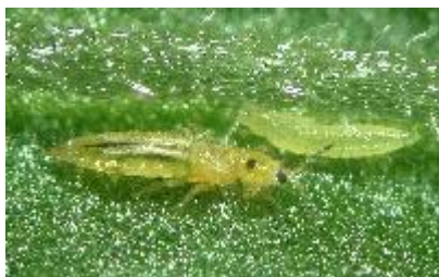
ミナミキイロアザミウマ成虫(左)と幼虫(右)

本種の成幼虫が葉や果実を加害しカスリ状の傷をつけ、被害果の商品価値は著しく低下する。