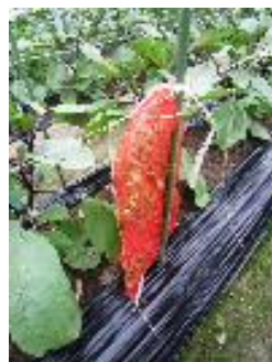
天敵の定着したゴマやクレオメをタマネギネットに入れ、吊す

また、放飼量が多いと、新葉に多数の穴が開き、蕾が加害で落ちたりするので注意する。薬剤に関する情報については、常に最新の情報を普及指導センターやJA等、指導機関から入手しておく。