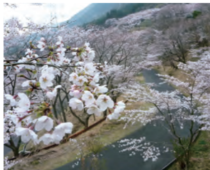
桜の名所 仲哀公園 (4月)

仲哀公園 ：約 1,800 年前、熊襲を征伐するため、仲哀天皇がこの地を一時都に定めたことから、この辺り一帯は仲哀天皇平という名で呼ばれています。春には、公園や道沿いの約 600 本あまりの桜が咲き誇り、桜の名所として知られています。