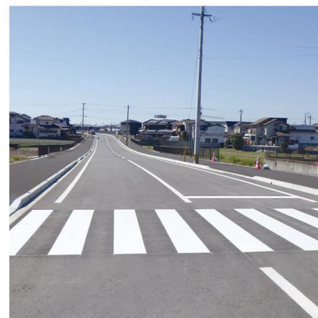
⑪ 主要地方道 久留米筑後線 前津工区 (筑後市)