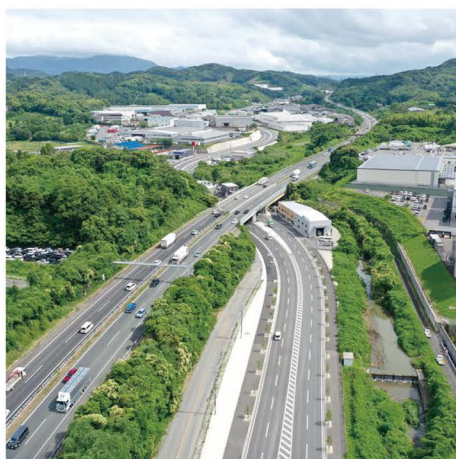
⑤ 主要地方道 筑紫野古賀線 古賀3工区 (古賀市)