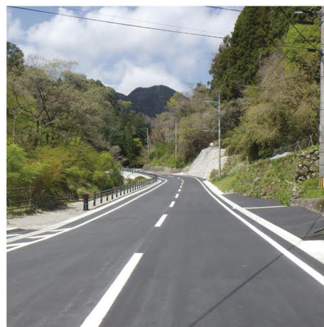
⑦ 主要地方道 八女香春線 竹工区 (東峰村)