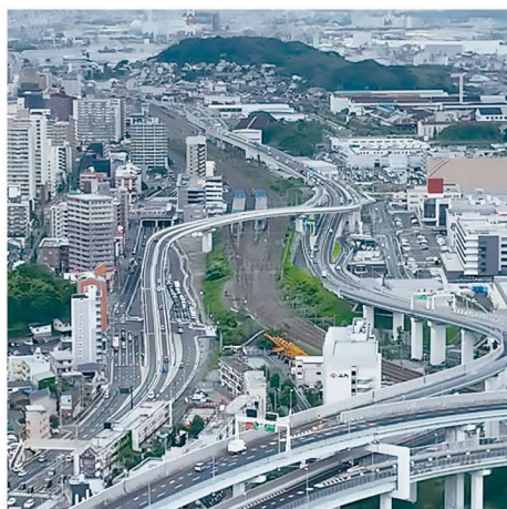
① 一般国道3号 黒崎バイパス (春の町ランプ・陣原ランプ) (北九州市)