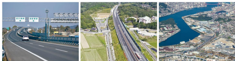
西九州自動車道 (福岡前原道路)