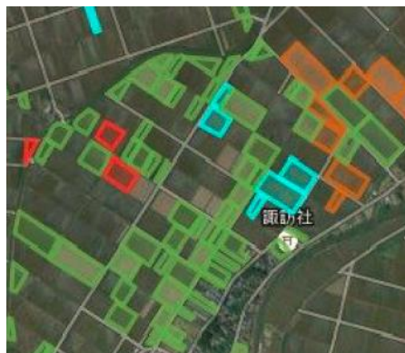
アグリノートのほ場管理画面