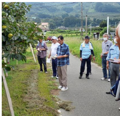
優良園の管理を学ぶ現地研修

今後も普及指導センターは、カキ生産者の経営改善が図られるよう、関係機関と連携しながら支援していきます。