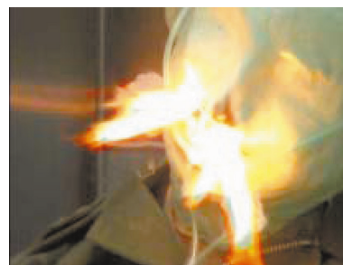
酸素がタバコの燃焼を助けて一気に炎が拡大します。