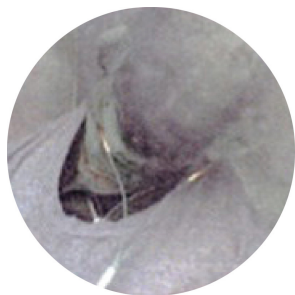
一旦発火すると、酸素を止めない限り燃え続けます。