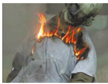
これが人形ではなく患者だったら…