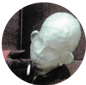
酸素吸入中に喫煙する際に