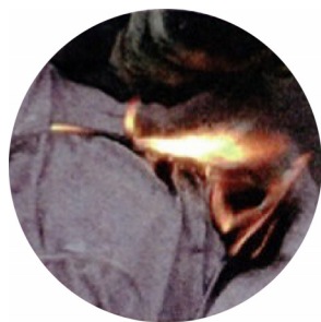
溶けた部分から炎を噴出し、導火線のように着衣に燃え移っていきます。