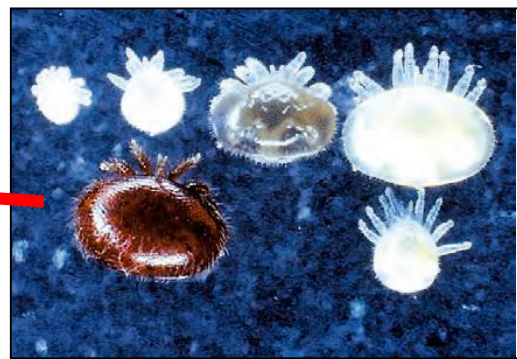
ミツバチヘギイタダニ