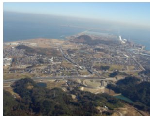
東九州自動車道(苅田北九州空港IC)