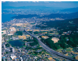
西九州自動車道(福岡前原道路)