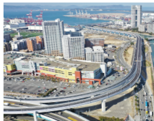
福岡高速6号線(福岡市)