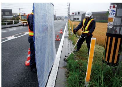
安全な通行を妨げている雑草の草刈