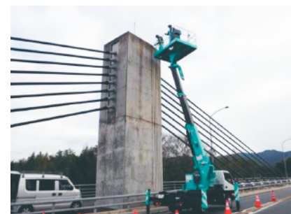
高所作業車による橋梁定期点検の状況