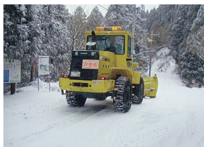
積雪時の雪氷対策