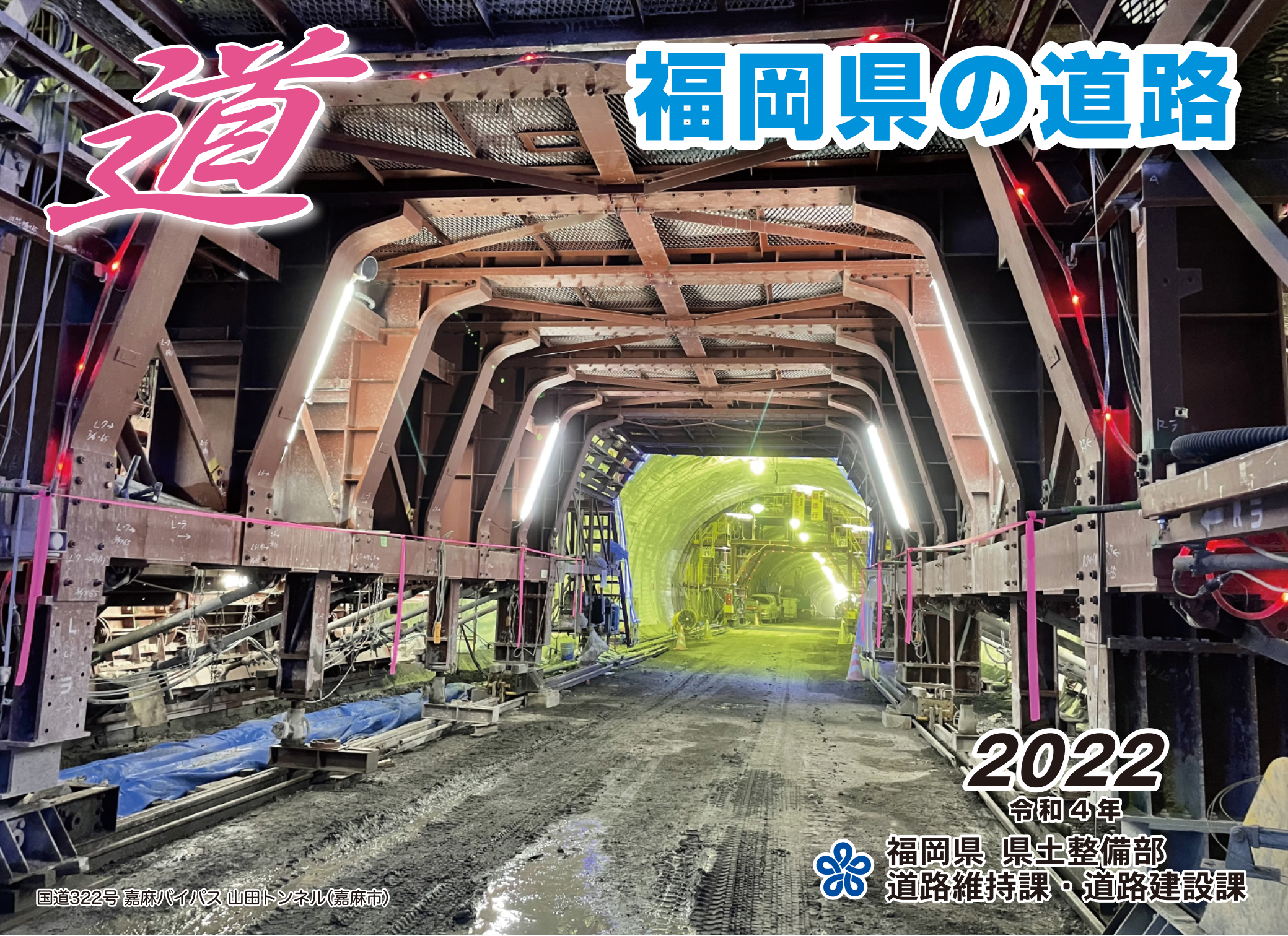
国道322号 嘉麻バイパス 山田トンネル(嘉麻市)