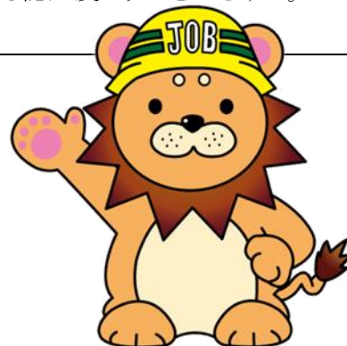
福岡県の職業訓練広報室長 じよぶまる。

平成27年度から県政モニターの集計をしているけど、高等技術専門校の認知度は、少しずつ上がっているよ！ 「県政モニター」の皆さんのご意参を参考にし、更なる認知度アップをめざすよ。