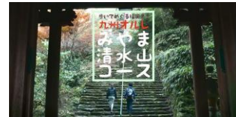
歩いてめぐる福岡県！九州オルレ みやま・清水山コース