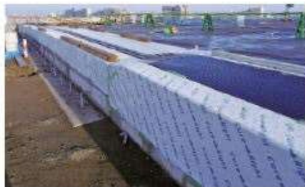
伸縮基礎設置周り