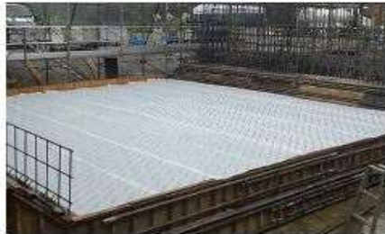
コンクリート現場打設