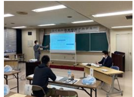
講座受講の様子（イメージ）