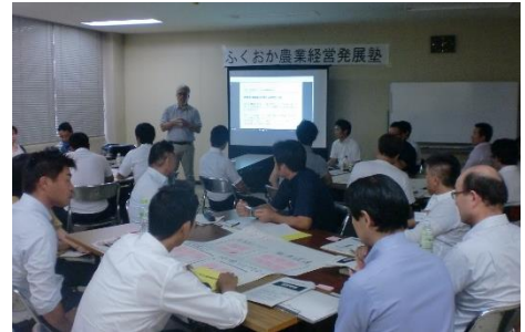
グループワークの様子(イメージ)

主に販売金額3,000万円以上で、事業計画(ビジネスプラン)を策定予定の農業経営体