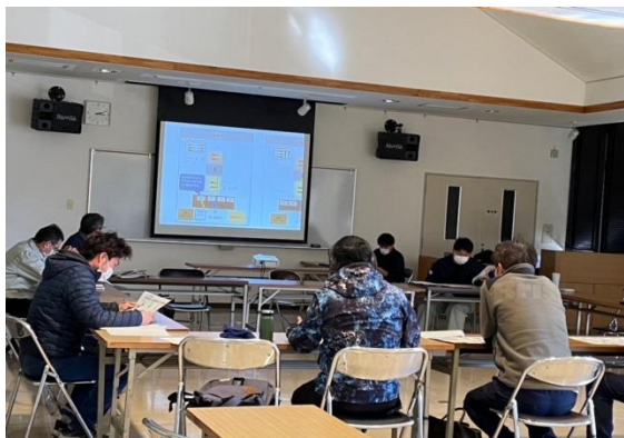
検討会に参加した生産者

普及指導センターでは、今後も生産者と連携して、省力化技術の普及に向けた活動を行っていきます。