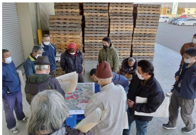
園地マップを囲み話し合う生産者