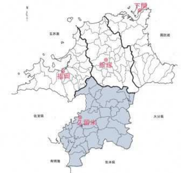
県南ブロック 範囲図