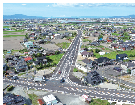
④ 主要地方道 大牟田川副線 大野島工区 (大川市)