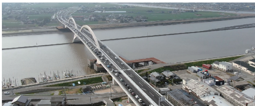
① 一般国道208号 有明海沿岸道路 (大川東IC～大野島IC) (大川市)