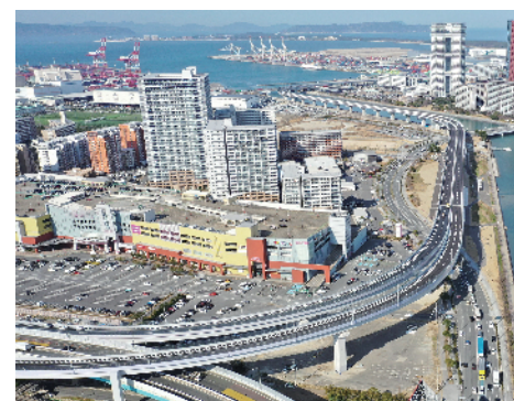
⑩ 福岡高速6号線 (福岡市)