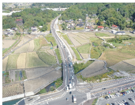
② 一般国道322号 香春大任バイパス (香春町～大任町)