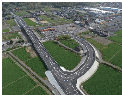
③ 主要地方道 高田山川線 今福工区 (みやま市)