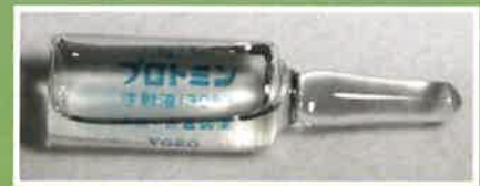
プロミン (注射薬) 国立ハンセン病資料館蔵