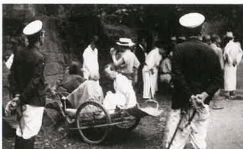
ハンセン病と診断された患者は強制的に療養所に入所させられました。

昭和28年（1953年）、患者の反対を押し切ってこの法律を引き継ぐ「らい予防法」が成立しました。この法律の問題点は、患者隔離が継続され、退所規定が設けられていないことでした。つまり、ハンセン病患者は療養所に収容されると、一生そこから出ることが出来なかったのです。