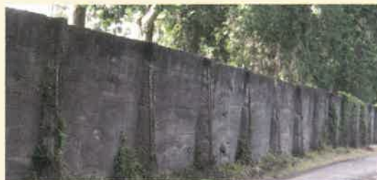
菊池恵楓園（熊本県）の隔離の壁

また、令和元年（2019年）、ハンセン病政策により家族も差別や偏見の被害を受けたとして、元患者の家族が国を相手に起こしたハンセン病家族訴訟についても、熊本地裁で原告勝訴の判決が下されました。