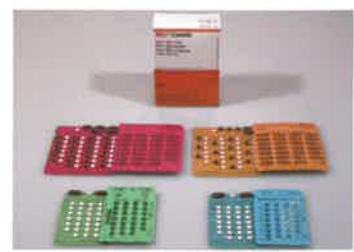
現在のハンセン病の薬

よく効く薬があって完全に治ります。また、薬を飲むと数日で「らい菌」は感染力を失い、早期に治療すれば後遺症も残りません。今、療養所で生活している人のほとんどはもう治っています。