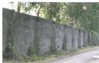
菊池恵楓園(熊本県)の隔離の壁

また、啓発(広く知ってもらおう)活動を積極的に行うなど、名誉回復のための対策を進めています。