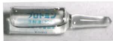
プロミン（注射薬）