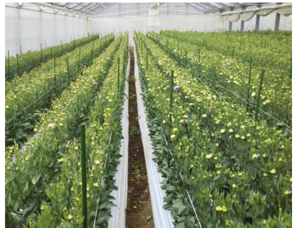
今後出荷が見込まれるトルコギキョウほ場