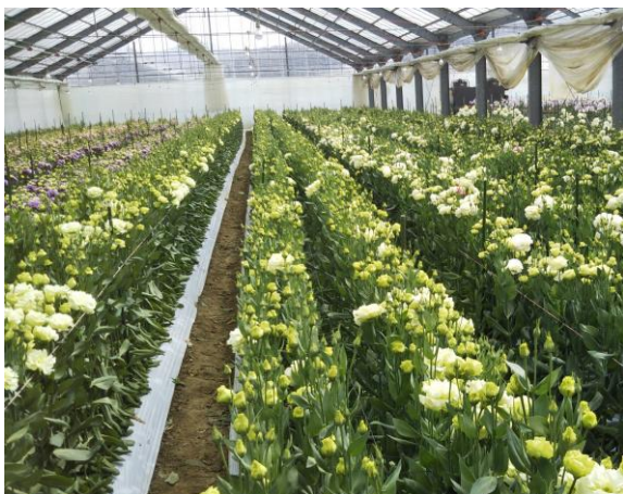
出荷直前のトルコギキョウほ場

今後普及指導センターでは、新たな技術の導入や改善、実践を支援し、経営発展に繋がるよう活動を進めていきます。