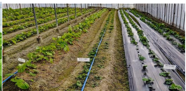
ウイルスフリー親株栽培試験ほ