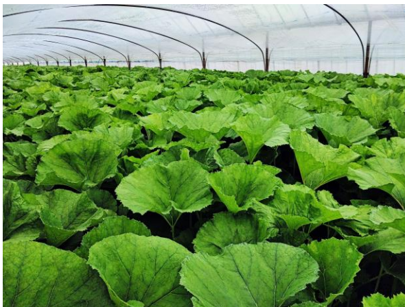
出荷直前のほ場の状況

今後も普及指導センターでは、部会の活動支援を通じて、フキの高品質安定生産を目指します。