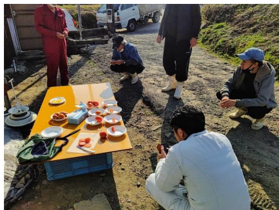
比較品種の食味試験