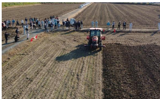
ロボットトラクタの自動運転を実演