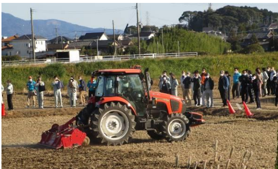
無人ロボットトラクタを説明