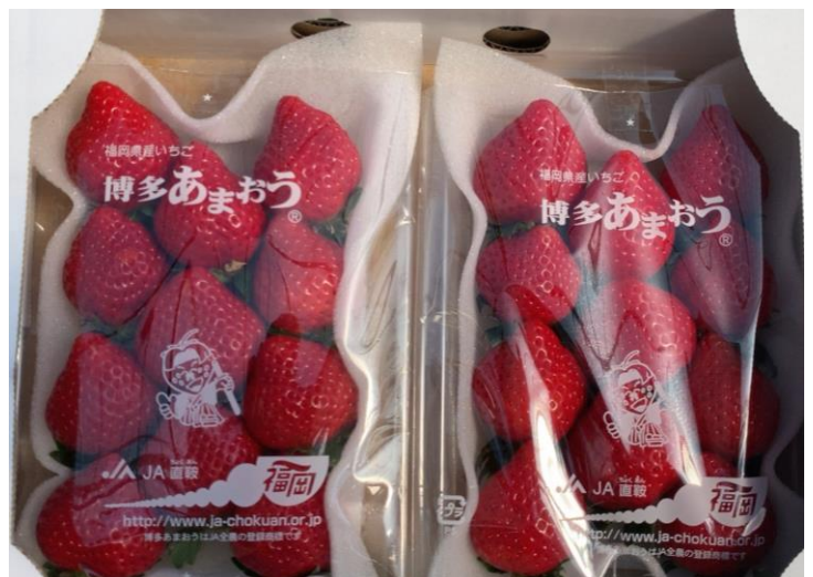
博多あまおう出荷時の荷姿