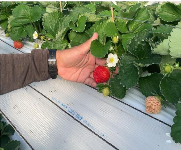
博多あまおう収穫の様子

今後も普及指導センターは、イチゴの安定出荷技術の普及や新規生産者の支援により、高収益なイチゴ経営を継続的に支援していきます。