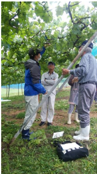
開花後管理講習会の様子