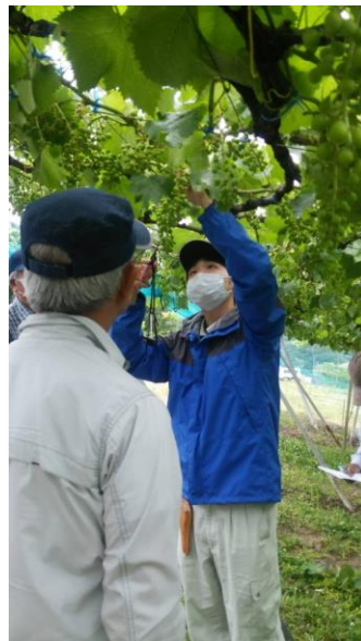
摘粒作業実演の様子