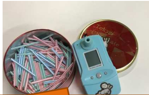
乗務前にアルコールチェッカーで検査を実施します