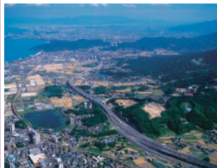
西九州自動車道(福岡前原道路)