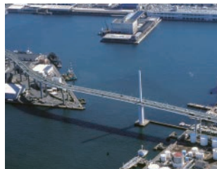
福岡高速道路(荒津大橋)