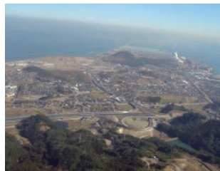
東九州自動車道(苅田北九州空港IC)