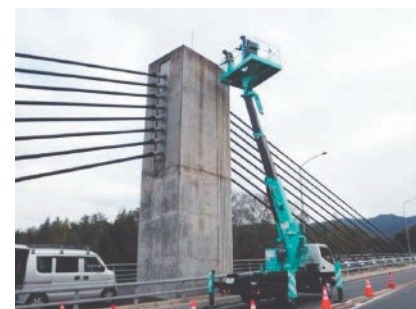
高所作業車による橋梁定期点検の状況