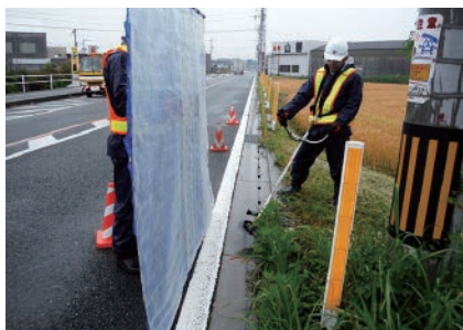
安全な通行を妨げている雑草の草刈