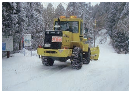
積雪時の雪氷対策