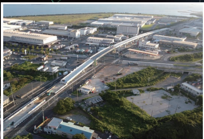
一般県道 新北九州空港線 (苅田町)