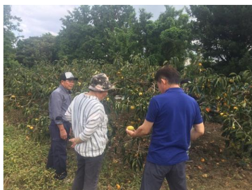
現地での目合わせの様子

普及指導センターでは、病虫害対策や栽培管理の指導を行ない、今後も消費者に糸島産の渋柿を安定的に供給できるよう、生産者への支援を継続していきます。