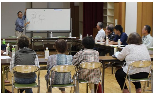
樹高切り下げや改植の補助事業を説明

普及指導センターはJAと連携して樹高切り下げや改植の支援を行い、産地の維持を支援しています。